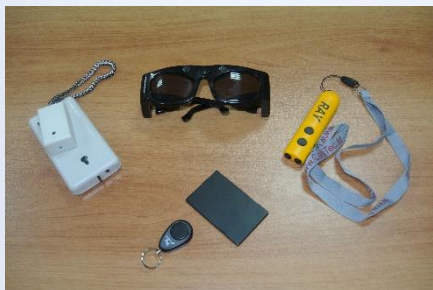
Говорящий маячок, ультразвуковые очки, электронная трость и др.